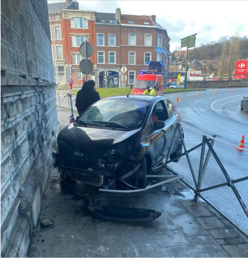
Accident du 2 janvier 2026

Une lettre collective adressée à M. le Bourgmestre de Liège a été envoyée par 6 Comités de quartier : Fragnée, Laveu, Bronckart-Botanique, Centre Avroy St Jacques, St Laurent St Martin et Cointe.